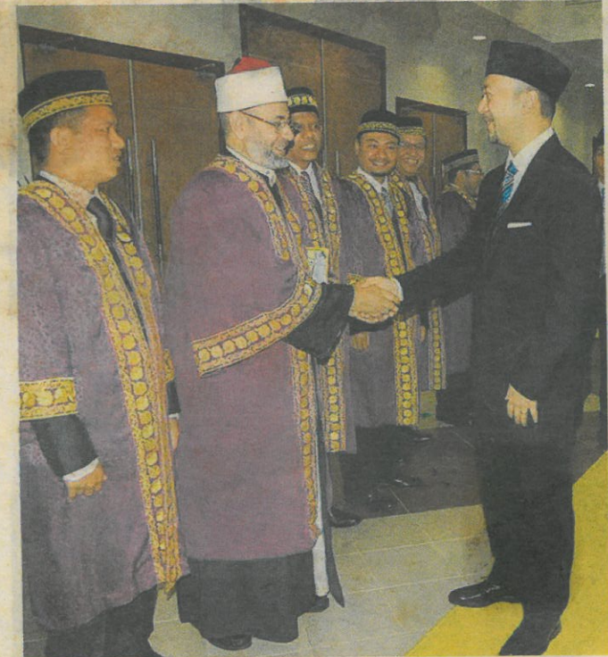
Menteri Besar Kedah, Datuk Mukhriz Mahathir mengambil kesempatan untuk beramah mesra dengan ahli-ahli Senat Insaniah.