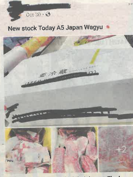
Antara daging wagyu tidak halal yang dijual secara dalam talian di pasaran Malaysia.