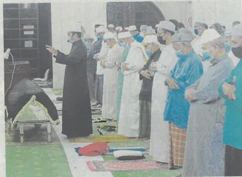
Jenazah Ungku Aziz disembahyangkan di Masjid At-Taqwa, Taman Tun Dr Ismail, Kuala Lumpur.

Allahyarham mendapat ijazah dalam bidang ekonomi pada 1951 di Universiti Malaya (UM), Singapura sebelum memperoleh Ijazah Doktor Falsafah (PhD) dalam bidang sama di Universiti Waseda,