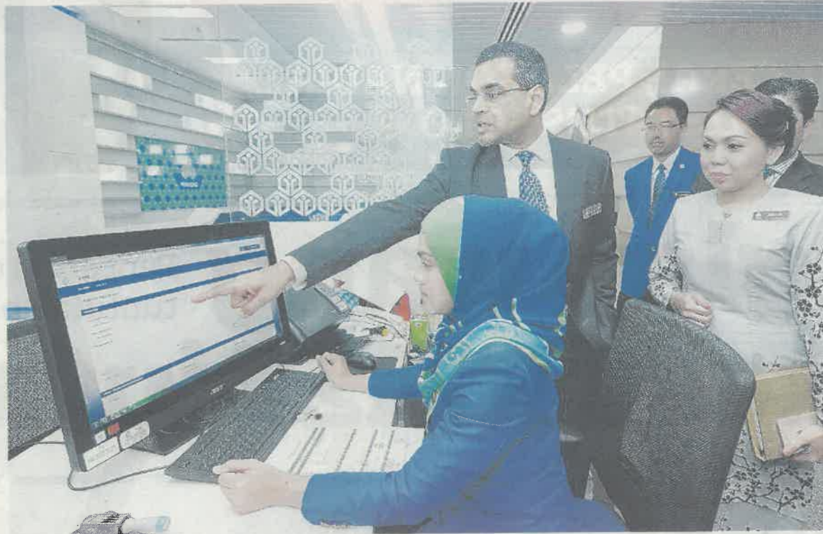
PEGAWAI dan kakitangan Perkeso sering melakukan saringan yang ketat dan teliti sebelum meluluskan sesuatu permohonan tuntutan yang dibuat oleh pencarum. - GAMBAR HIASAN

Tambahnya, kes penipuan tuntutan faedah caruman diklasifikasikan kepada jenis faedah yang disediakan atau diberi kepada Orang Berinsurans.