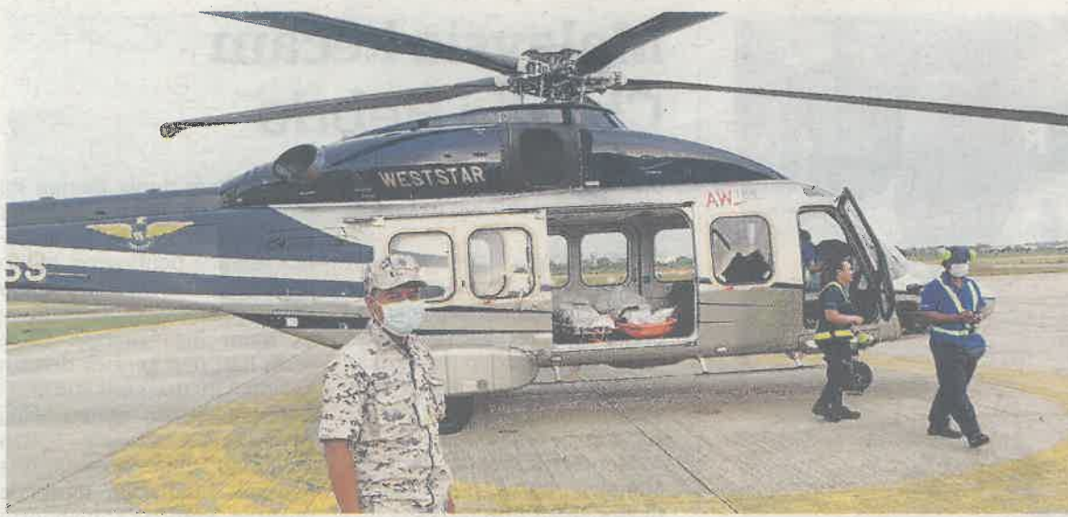
MANGSA yang meninggal dunia diterbangkan dengan pesawat AW 189 Petronas di Lapangan Terbang Miri.