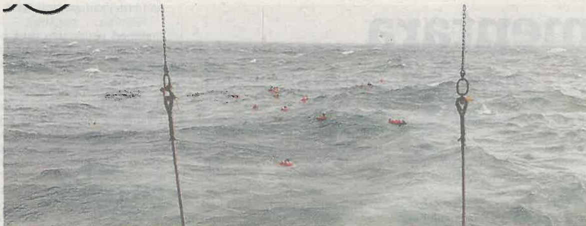
SEBAHAGIAN mangsa bertindak terjun ke laut selepas kapal terlibat melanggar pelantar minyak.

Mangsa-mangsa yang diselamatkan dibawa ke Miri oleh kapal-kapal yang terlibat dengan operasi menyelamat, manakala