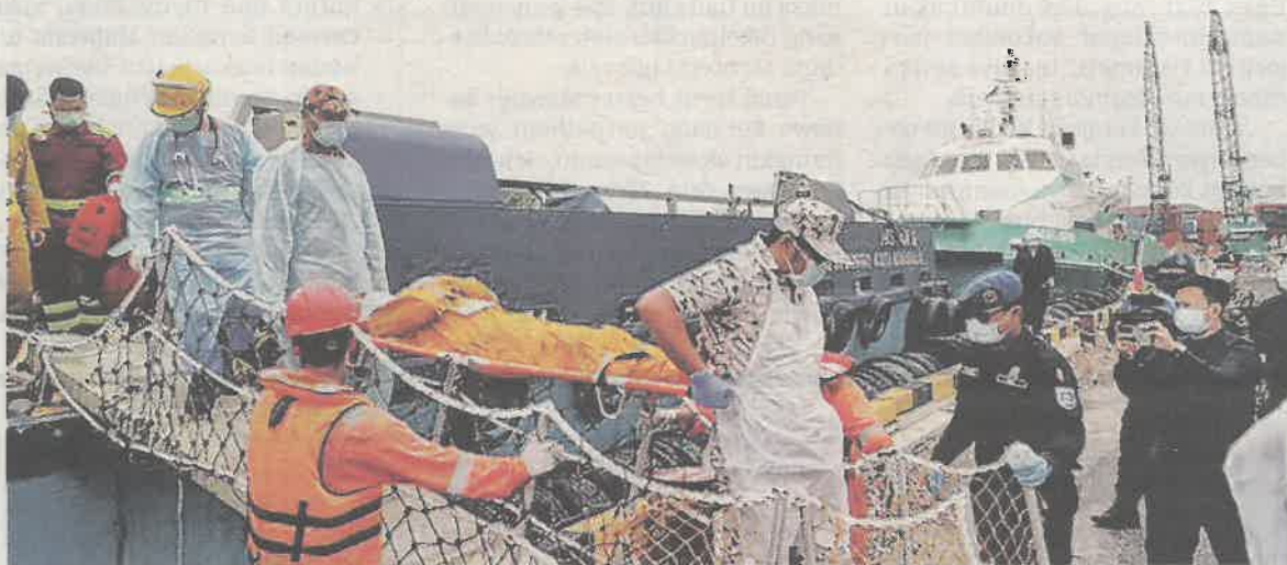
PETUGAS keselamatan menurunkan kru yang cedera untuk mendapatkan rawatan di Pelabuhan Miri.

dua mangsa yang cedera dihantar ke Hospital Miri.