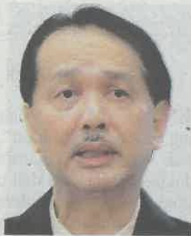
DR NOOR HISHAM

Menurutnya, setakat jam 12 tengah hari semalam, seramai 109 individu telah disaring bagi kluster tersebut dan langkah pencegahan jangkitan termasuk proses nyah kuman serta proses pembersihan telah dijalankan di