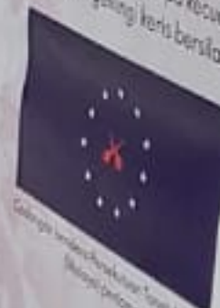
Calangan bendera Persekutuan Tanah Melayu (Malaysia Darul Amin)

Pada 15 November 1949, Jawatankuasa ini mengemukakan 373 reka bentuk bendera kepada Majlis Perundangan Persekutuan untuk pertimbangan dan pemilihan. Daripada jumlah itu, tiga reka bentuk dipilih. Daripada jumlah itu, tiga reka bentuk hampir serupa kecuali 11 bintang pecah lima membentuk dua bukitan mengulangi keris bersilang