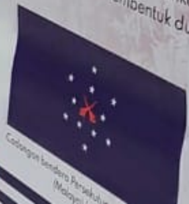
Calangan bendera Persekutuan Tanah Melayu (Malaysia Darul Amin)