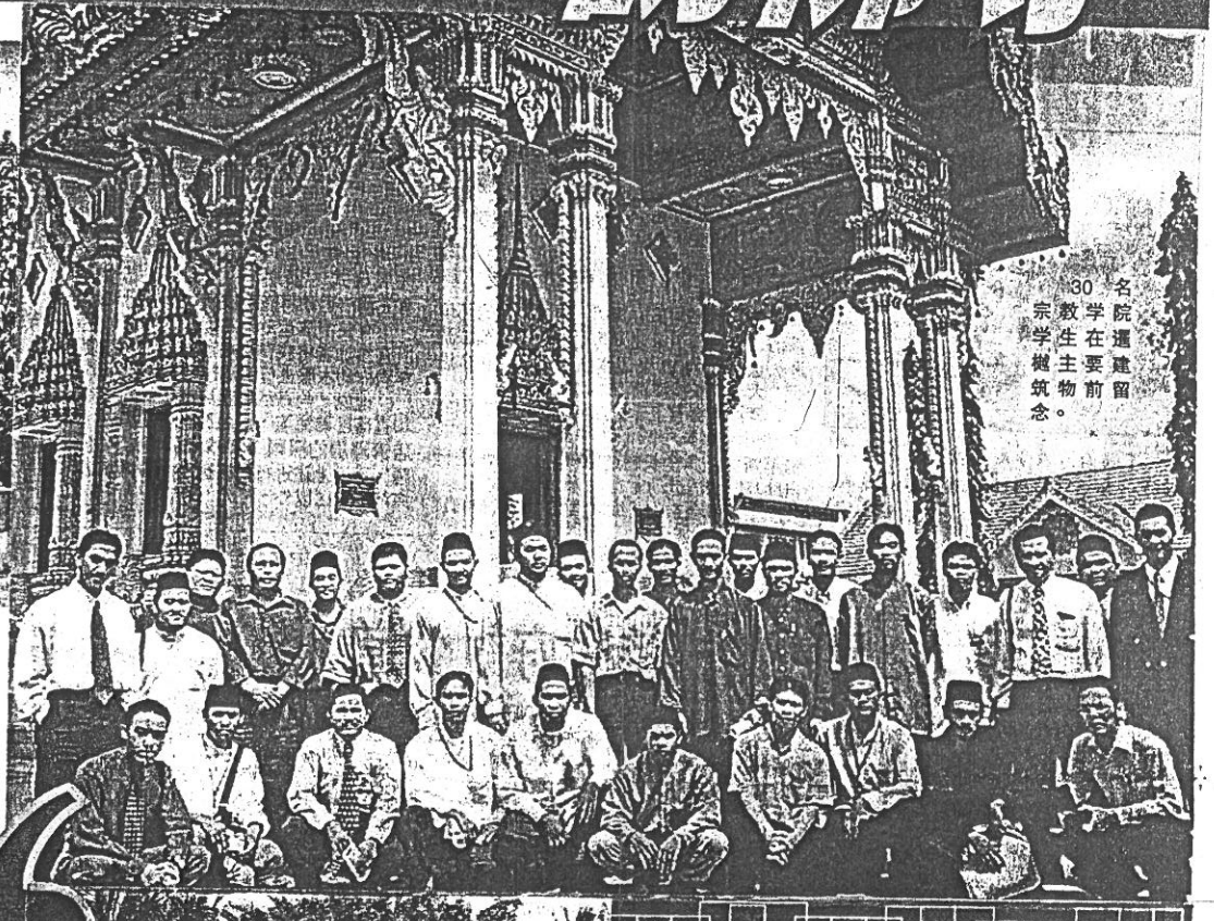
30名學院暹槌宗教學生在主要前物紀念。

會迸發出怎樣的火花？ 一批在宗教學院選修“宗教比較學”課程的二年級學生，經過多年深入钻研回教知識之後，今回主動提出嘗試了解其他宗教內容、形式之要求，包括主動要求參觀、訪問暹槌並與佛教界人士對話，藉此學術考察活動了解佛教徒思想內容，搜集課程所須的參考實據和資料。 去年也曾有8名北方大學回教徒學生訪問團造訪暹槌，唯這回宗教學院學生堪稱首度踏足暹槌，並願意接納、听取、學習佛教歷史及佛學知識，到訪時因此受到暹槌管理層友善款待。