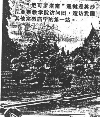
“尼可羅塔南”暹槌是英沙尼亞宗教學院訪問團，造訪我國其他宗教廟宇的第一站。