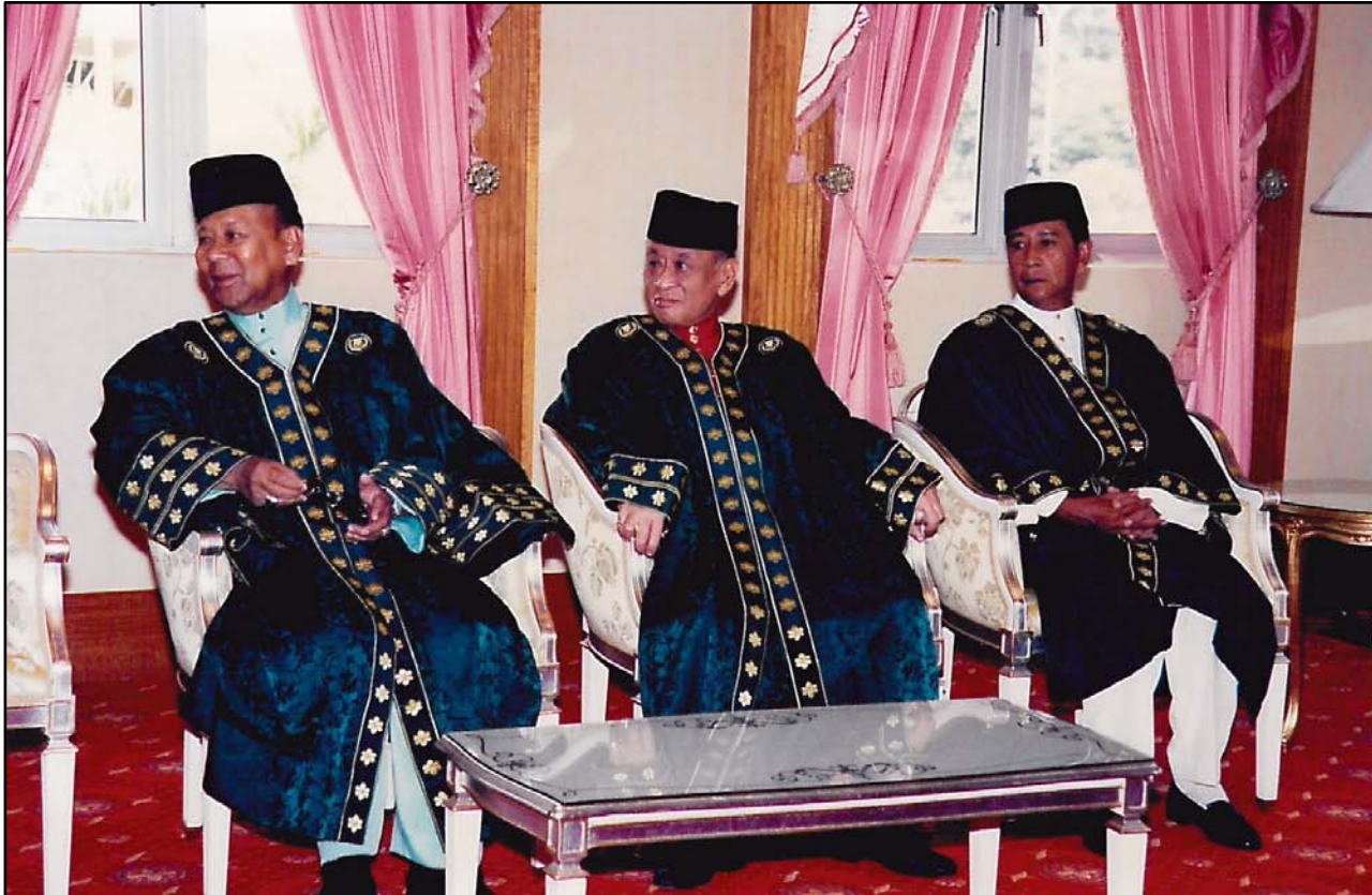
KDYMM Tuanku Sultan Abdul Halim Ibni Almarhum Sultan Badlishah, DYTM Tunku Haji Abdul Malik Al-Haj Ibni Almarhum Sultan Badlishah serta YTM Tunku Sallehuddin Ibni Almarhum Sultan Badlishah di dalam Bilik Menunggu Diraja.