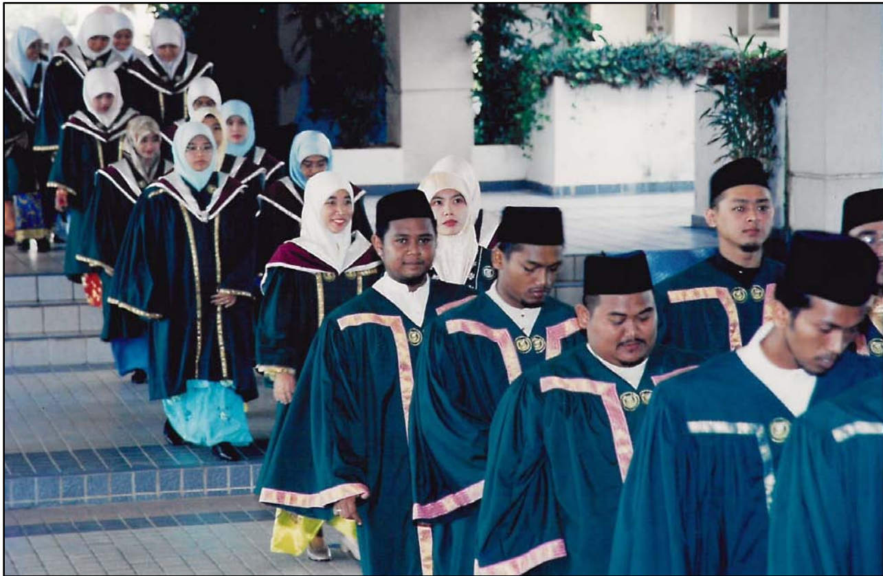
Sebahagian lagi graduan Majlis Hafluttakharruj Ke-5.