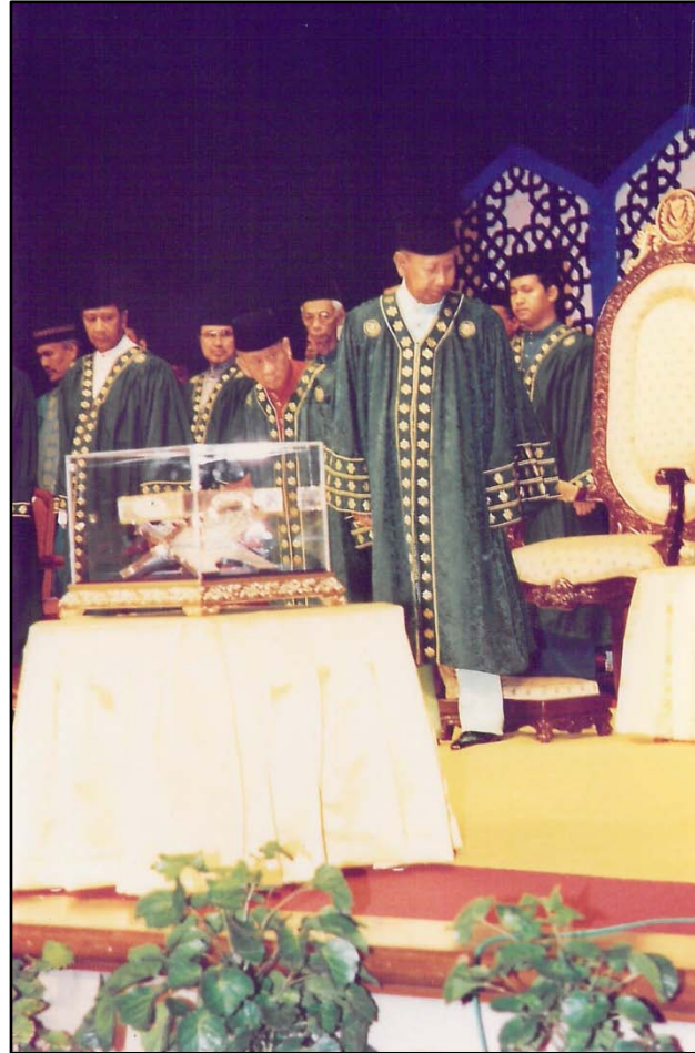
KDYMM Tuanku Sultan dan Ahli Perarakan Besar tiba di atas pentas.