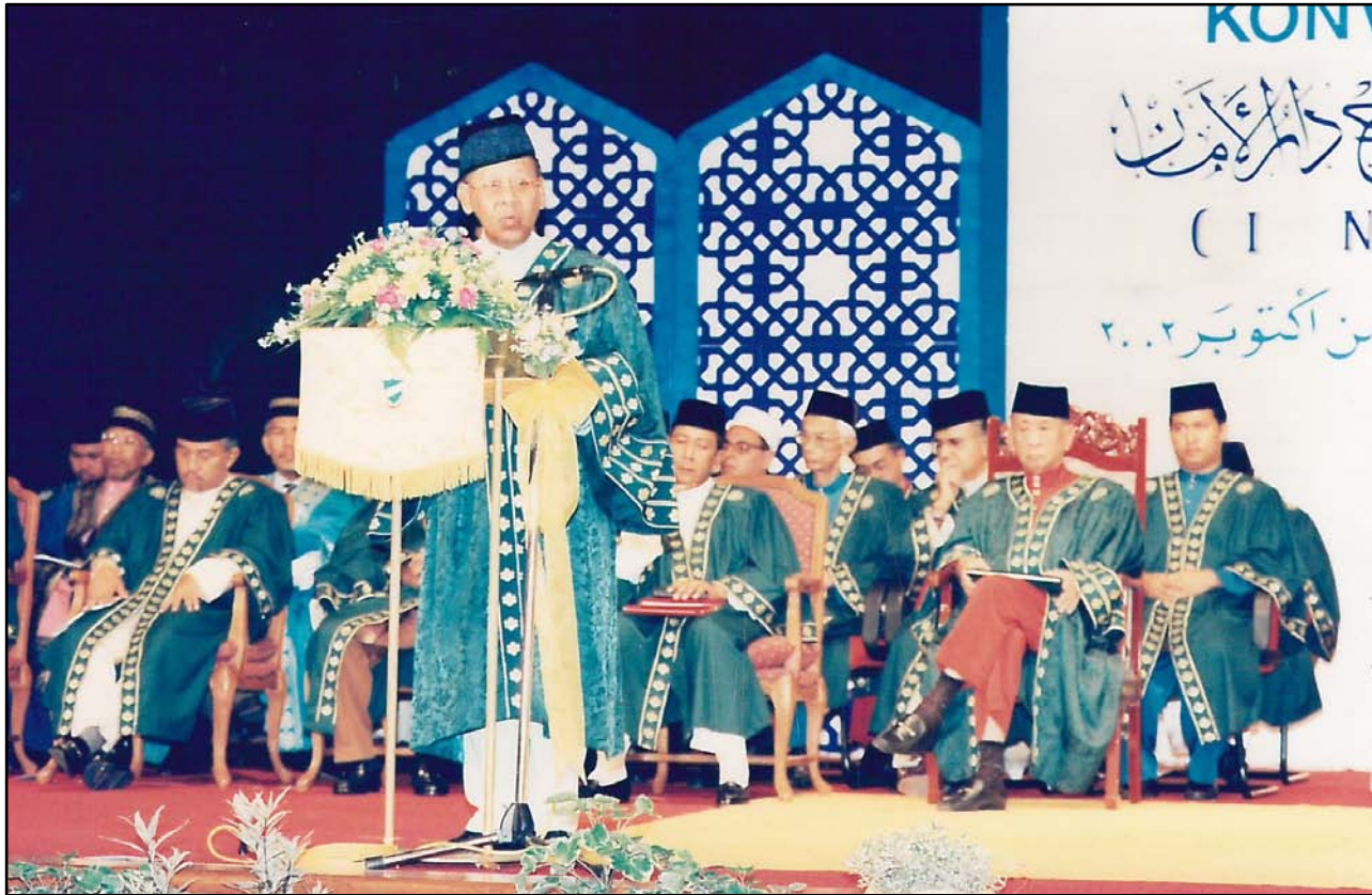
KDYMM Tuanku Sultan bertitah sempena Majlis Hafluttakharruj Ke-5.