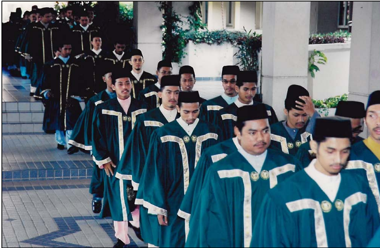
Barisan Perarakan Graduan bergerak masuk ke dalam dewan.