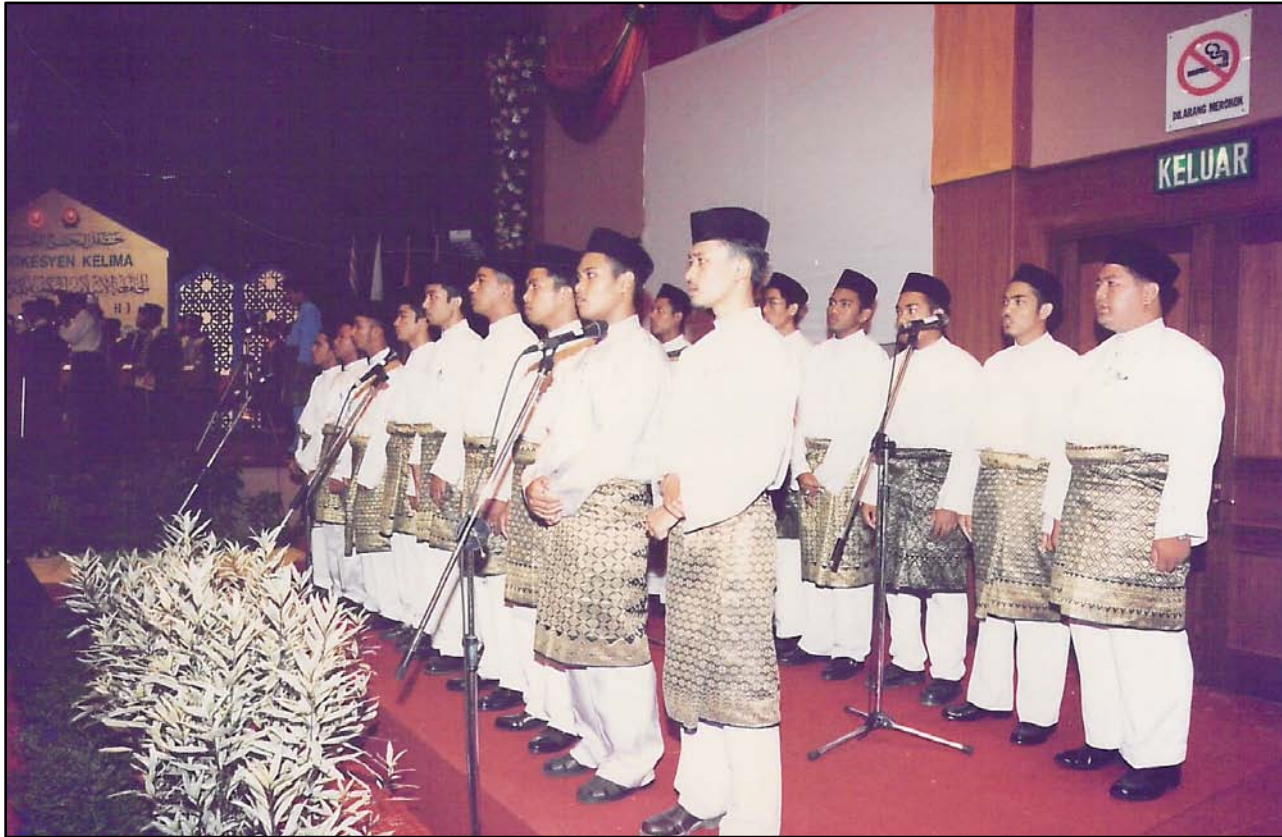
Kumpulan Nasyid yang terdiri daripada pelajar INSANIAH memperdengarkan alunan selawat dan nasyid.