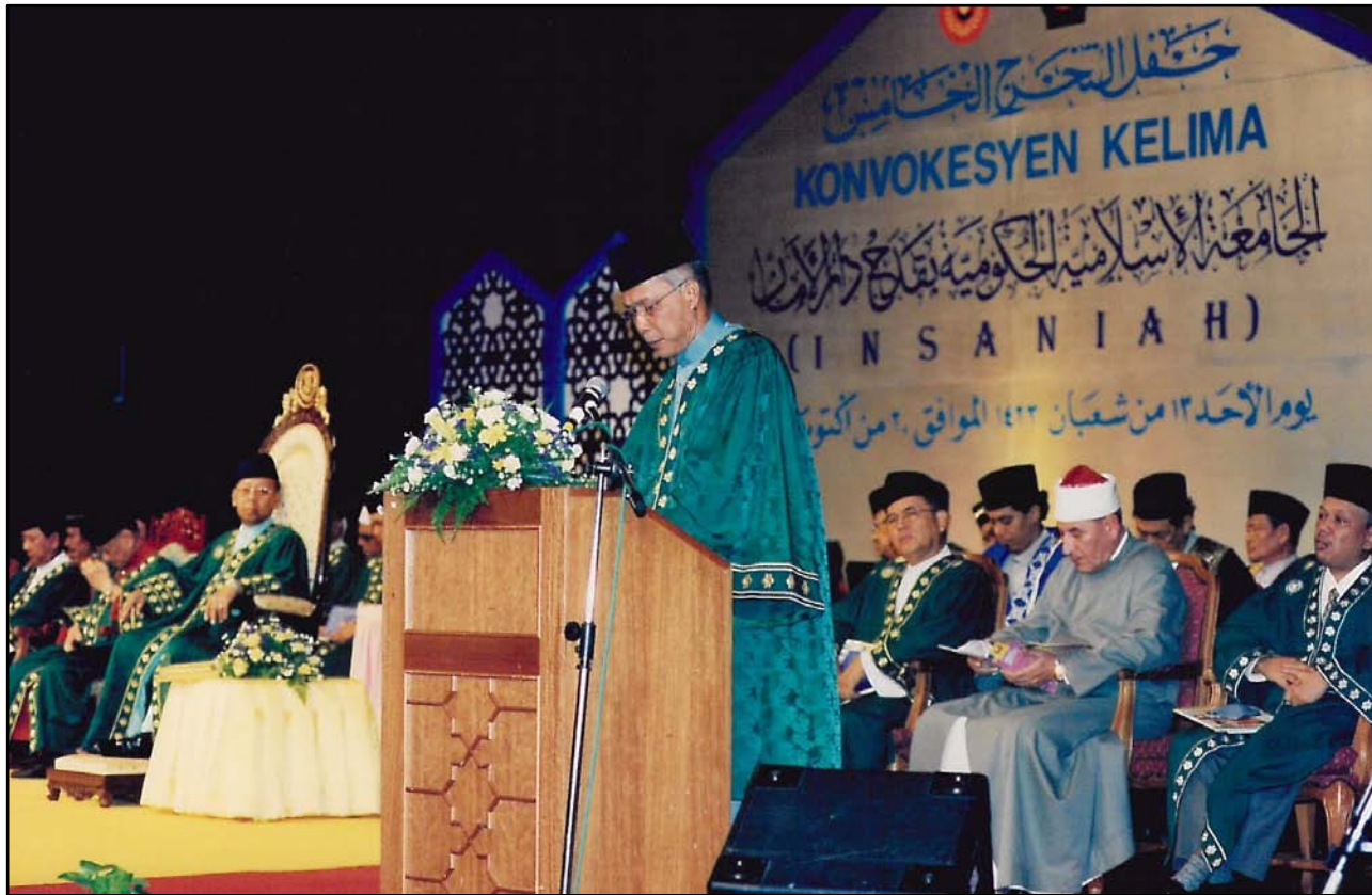
Ucapan kepada para hadirin.