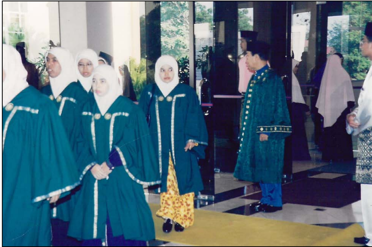
Kumpulan graduan akhir yang bergerak ke dalam dewan.