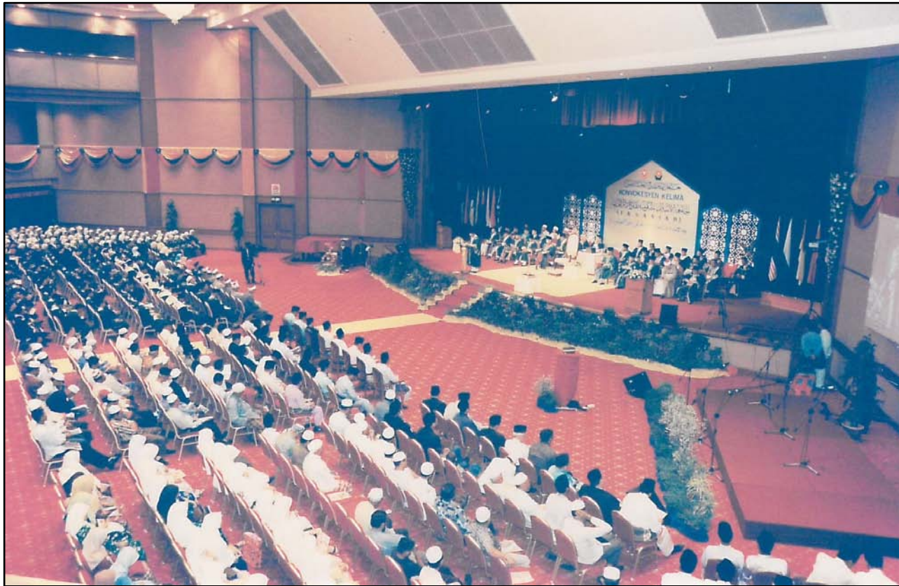
Suasana di dalam Dewan Seri Negeri, Wisma Darul Aman ketika majlis berlangsung.