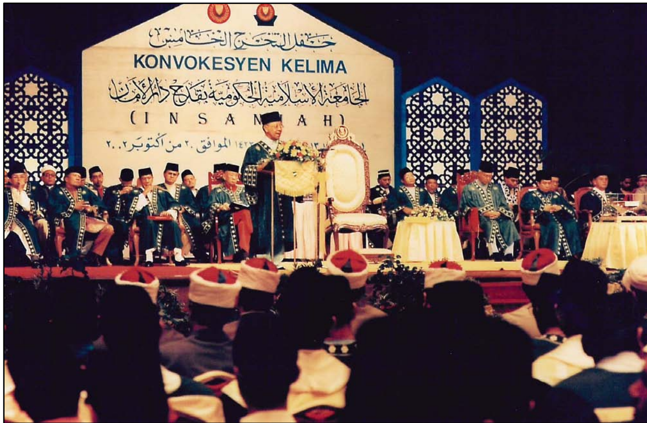
Titah ucapan daripada KDYMM Tuanku Sultan.