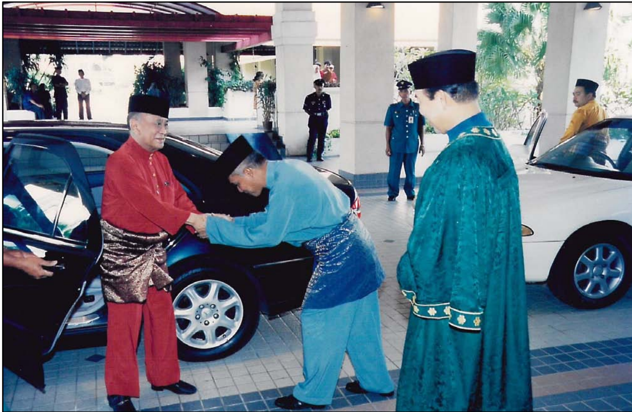
Ketibaan DYT M Tunku Haji Abdul Malik Al-Haj Ibni Almarhum Sultan Badlishah, Raja Muda Kedah disambut oleh YAB Menteri Besar dan Pengarah INSANIAH.