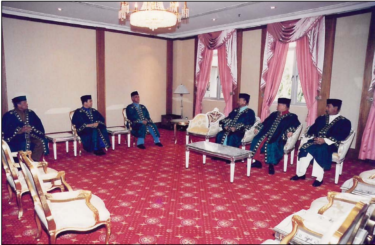
KDYMM Tuanku Sultan perkenan menerima mengadap YAB Menteri Besar, YB EXCO Negeri Kedah serta Pengarah INSANIAH.