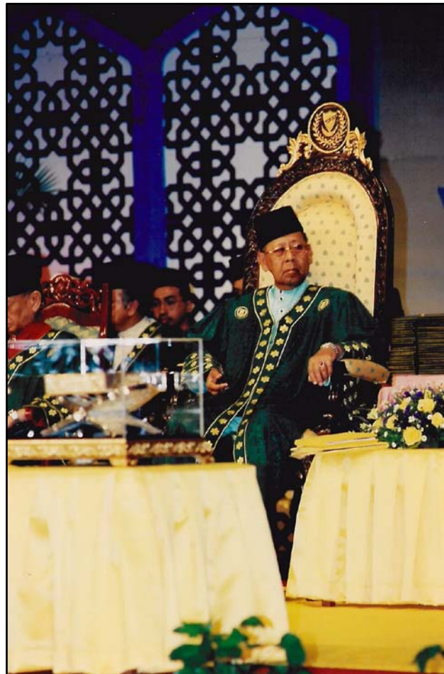
KDYMM Tuanku Sultan bersemayam di atas singgahsana istiadat.