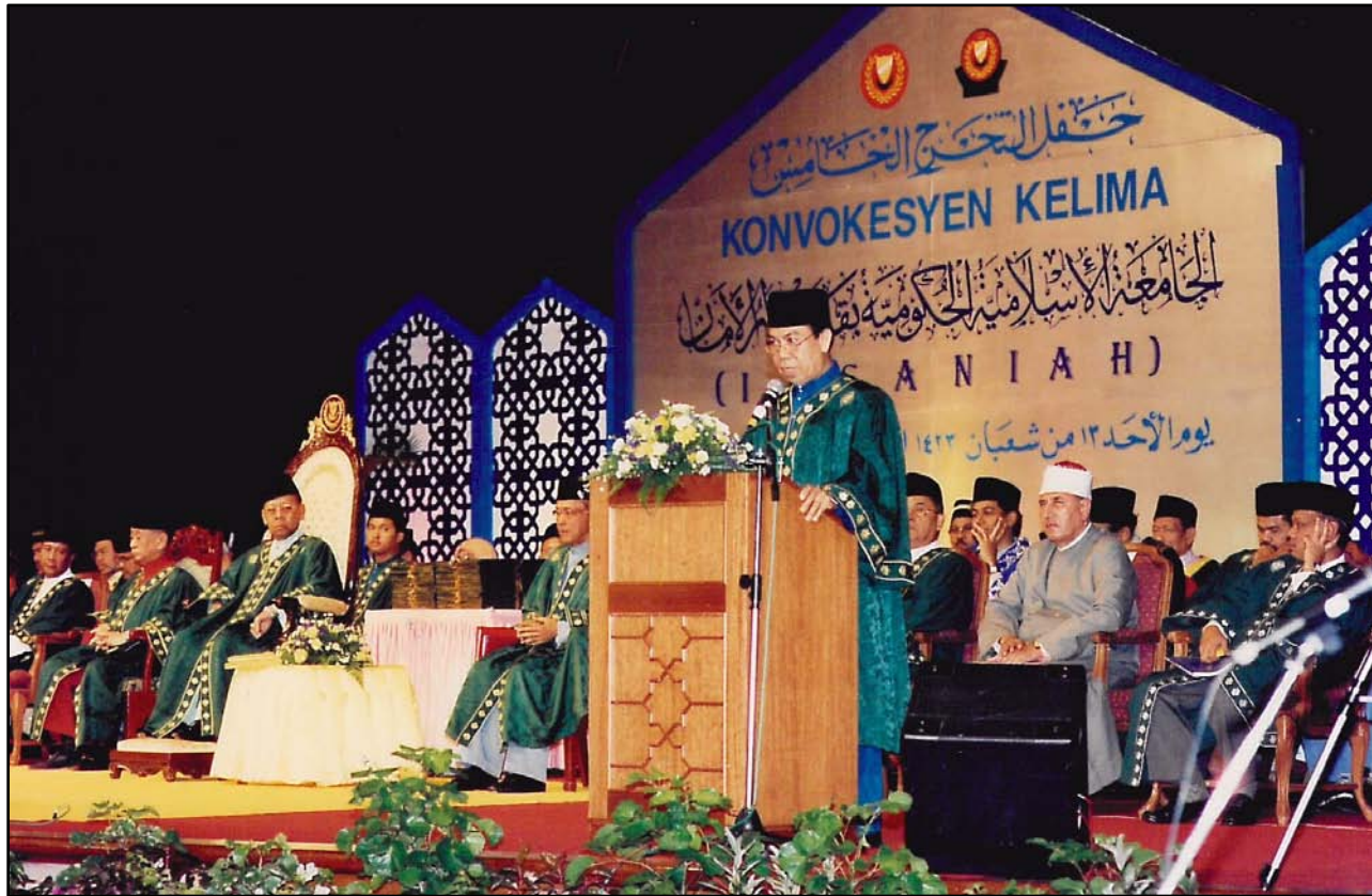
Ucapan daripada Pengarah INSANIAH.