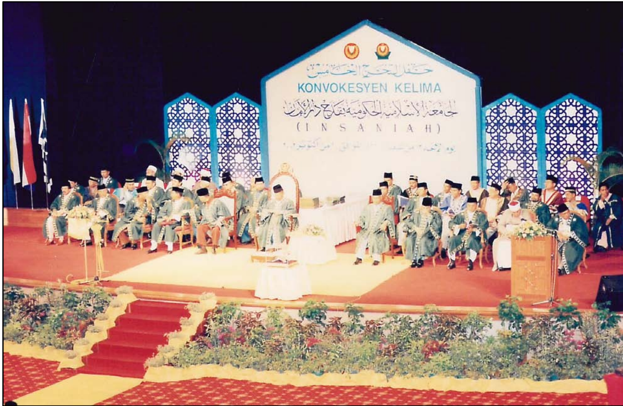
Majlis Hafluttakharruj Ke-5 yang berlangsung di Dewan Seri Negeri, Wisma Darul Aman.