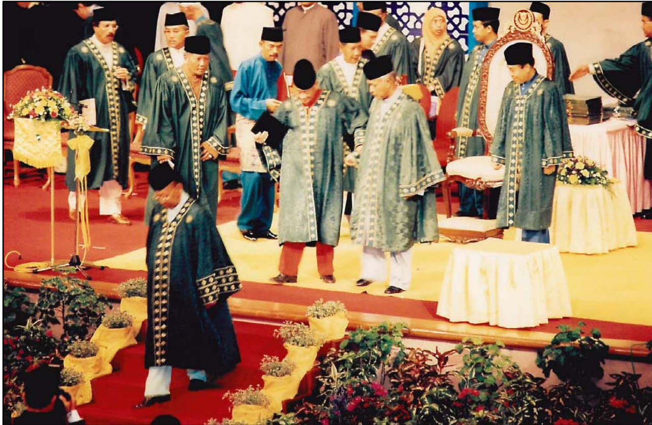
KDYMM Tuanku Sultan bersama Ahli Perarakan Besar menuruni pentas untuk meninggalkan dewan.