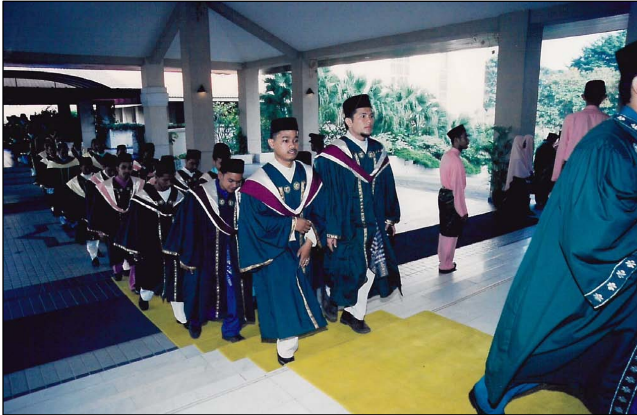
Perarakan masuk ke dalam dewan bermula.