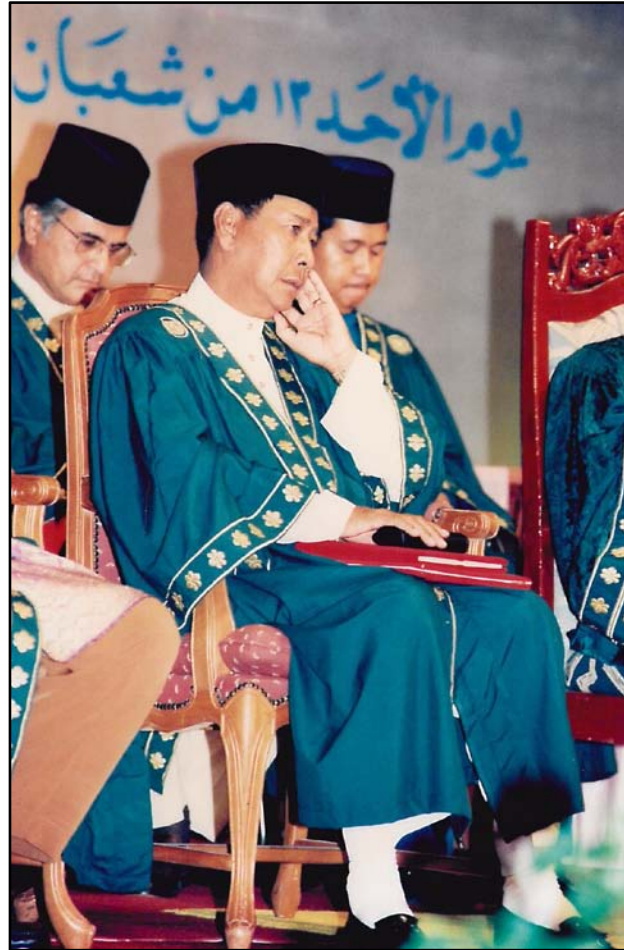
Yang Teramat Mulia Tunku Sallehuddin Ibni Almarhum Sultan Badlishah, Tunku Temenggong Kedah.