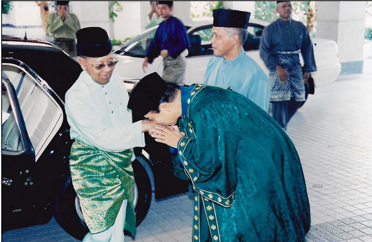
Keberangkatan tiba KDYMM Tuanku Sultan ke Majlis Hafluttakharruj Ke-5 disambut oleh Pengarah INSANIAH dan YAB Menteri Besar.