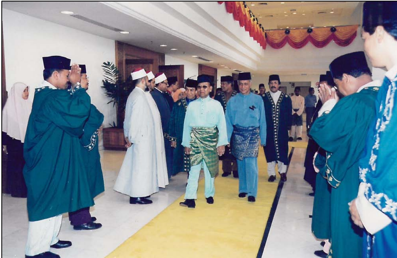
KDYMM Tuanku Sultan diiringi oleh YAB Menteri Besar ke Bilik Menunggu Diraja untuk memakai jubah konvokesyen.