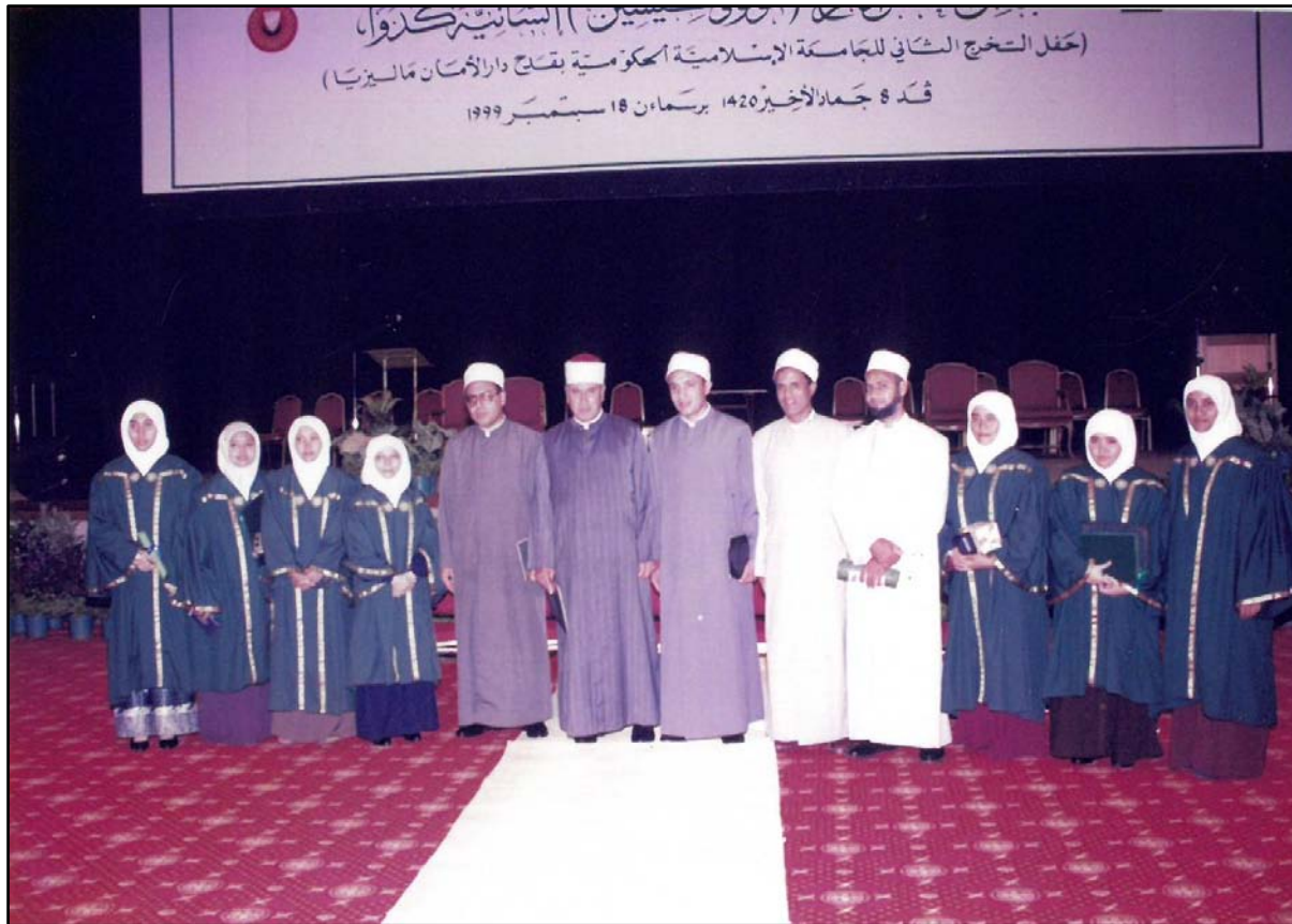
Bergambar bersama pensyarah masing-masing.