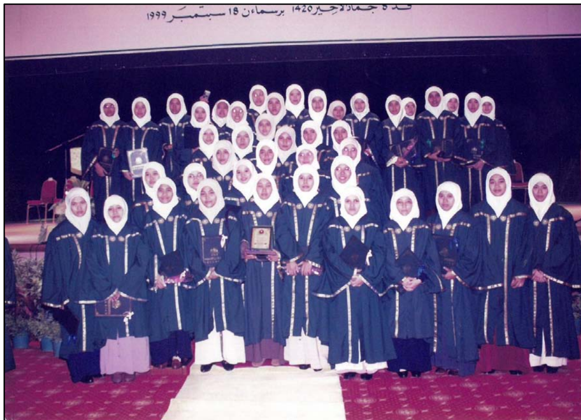
Sebahagian graduan bergambar kenangan setelah selesai Majlis Hafluttakharuj Ke-2 pada 18 September 1999 di Dewan Seri Negeri, Wisma Darul Aman.