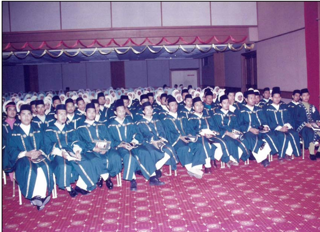
Sebahagian graduan di dalam dewan istiadat.