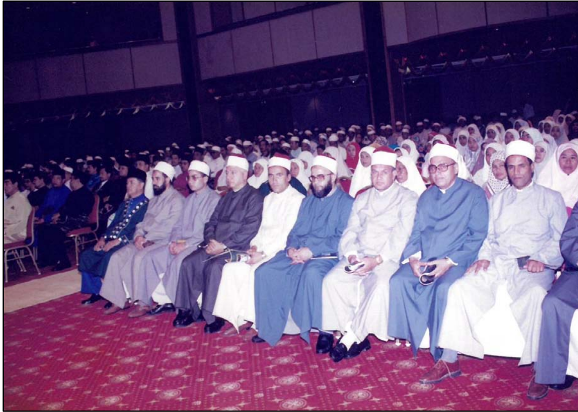
Sebahagian pensyarah yang dipinjamkan dari Universiti Al-Azhar, Mesir yang berkhidmat di INSANIAH hadir ke Istiadat Hafluttakharruj Ke-2.