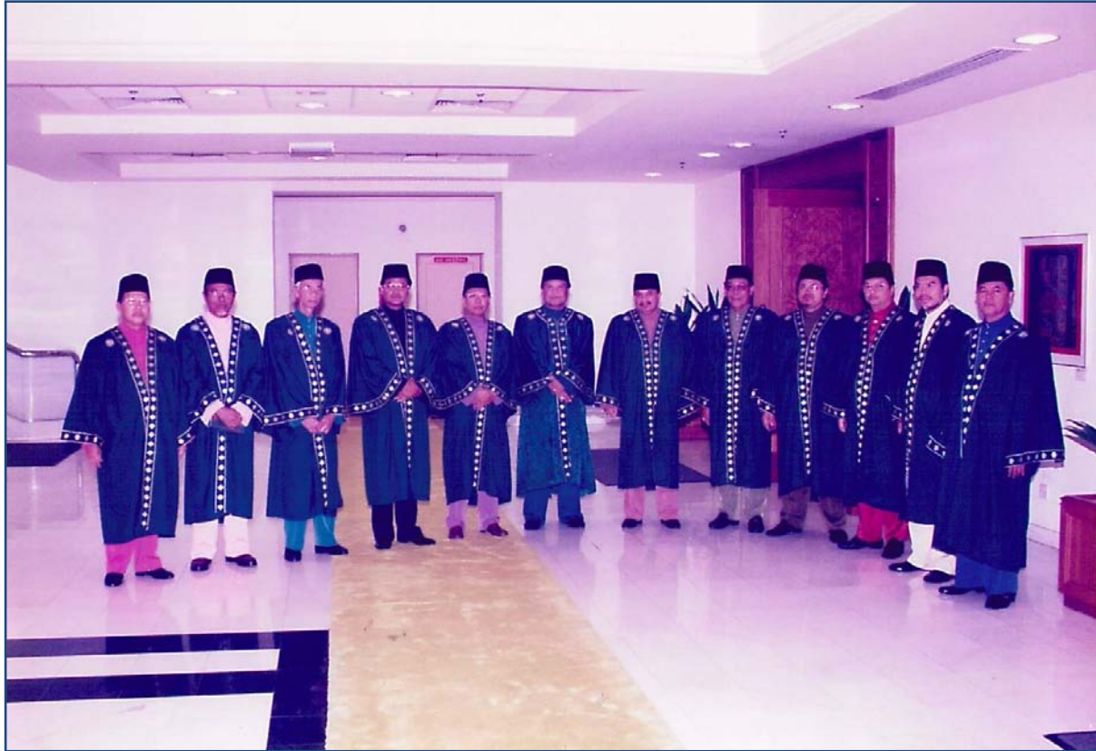
Ahli Perarakan Besar Majlis Hafluttakharruj Ke-2 pada 18 September 1999 bergambar kenangan di hadapan Dewan Seri Negeri, Wisma Darul Aman.