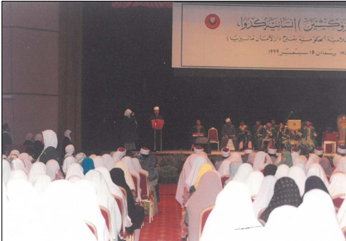
Graduan mengangkut sembah sebaik tiba di atas pentas.