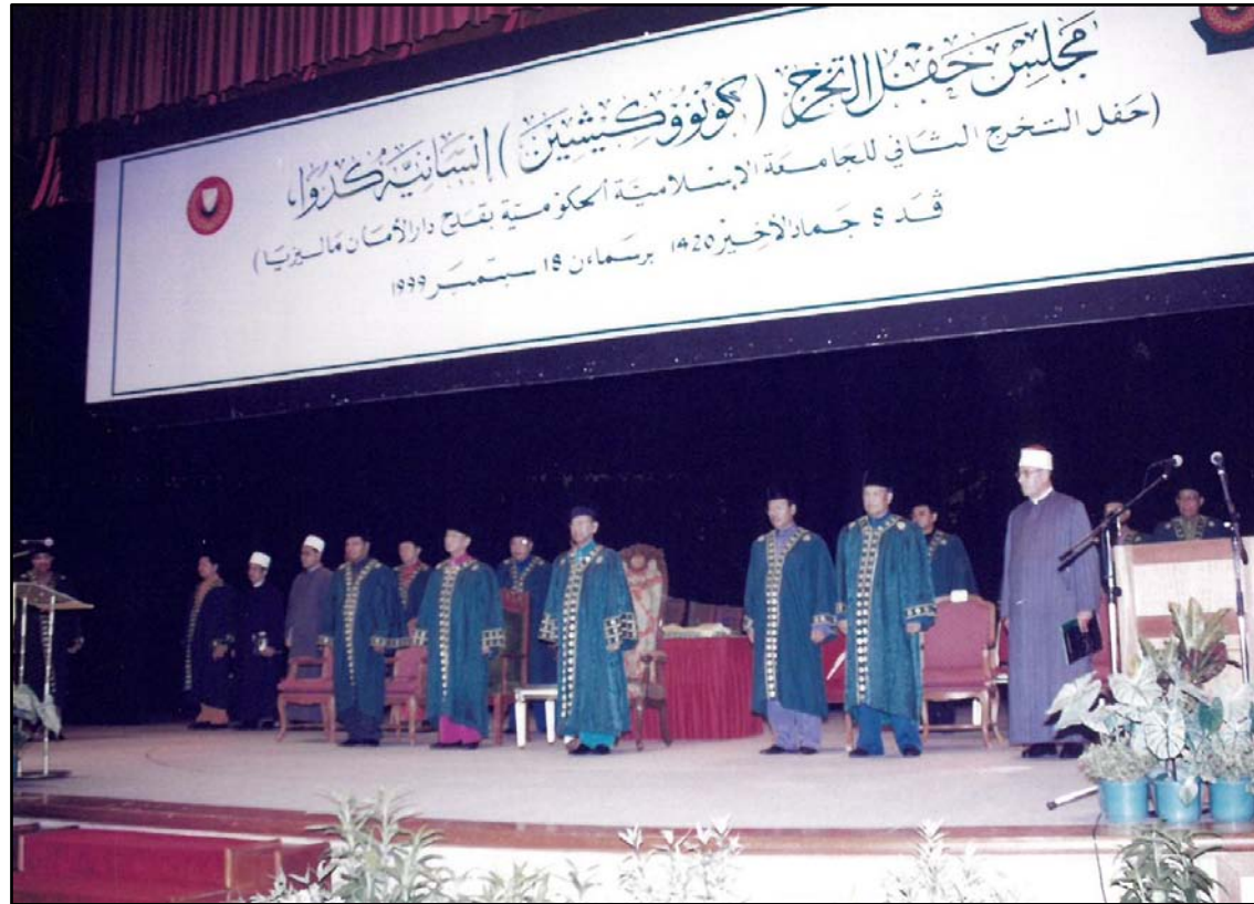
Lagu Allah Selamat Sultan dimainkan.