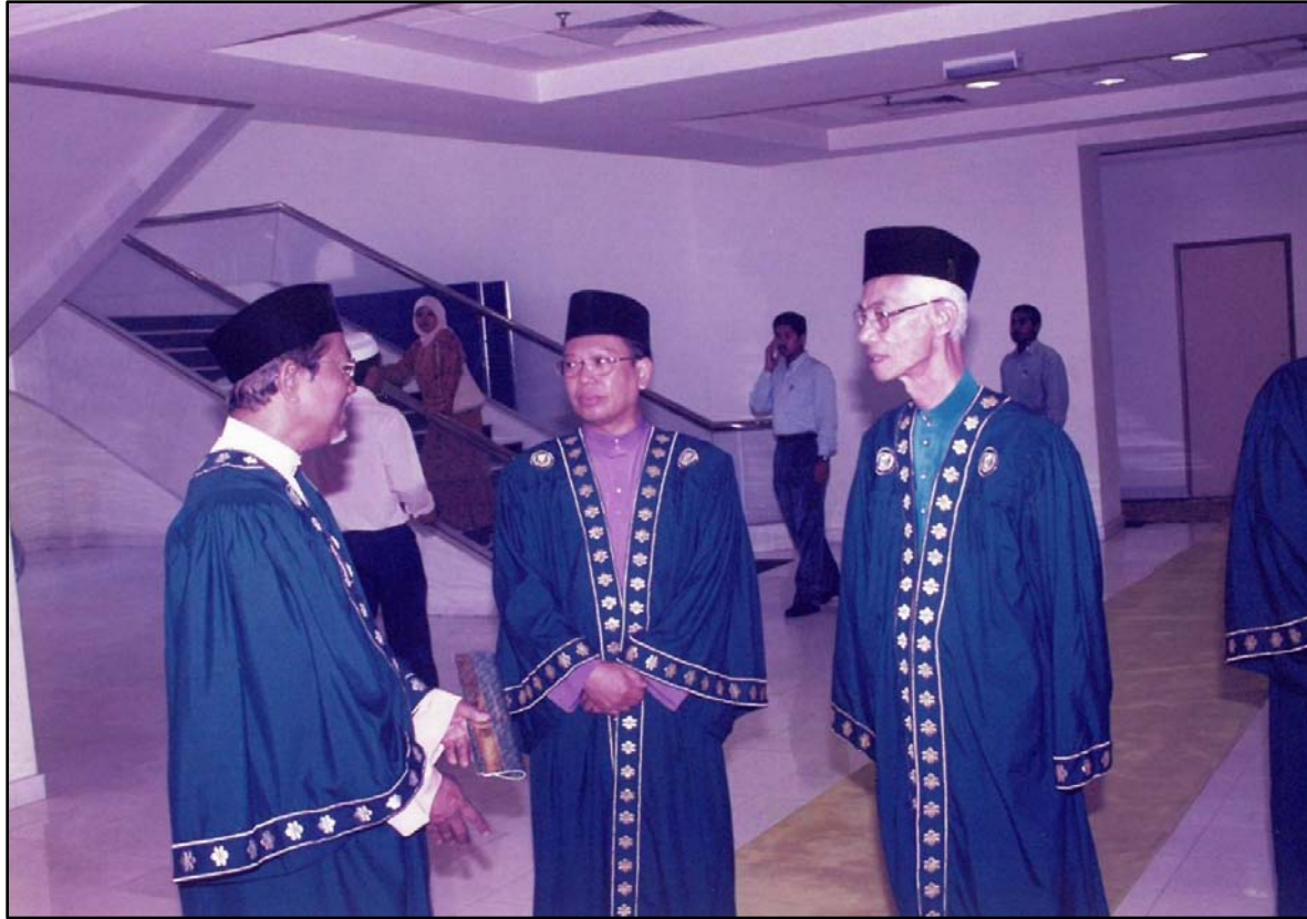
Ahli Perarakan Besar Majlis Hafluttakharruj Ke-2 pada 18 September 1999 bergambar kenangan di hadapan Dewan Seri Negeri, Wisma Darul Aman.