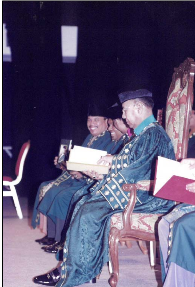
KDYMM Tuanku Sultan meneliti Buku Program.