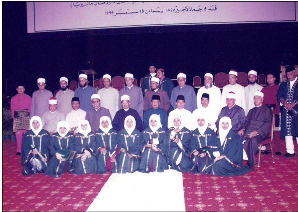
Graduan mengambil kesempatan bergambar bersama Pengurusan Tertinggi dan pensyarah INSANIAH.