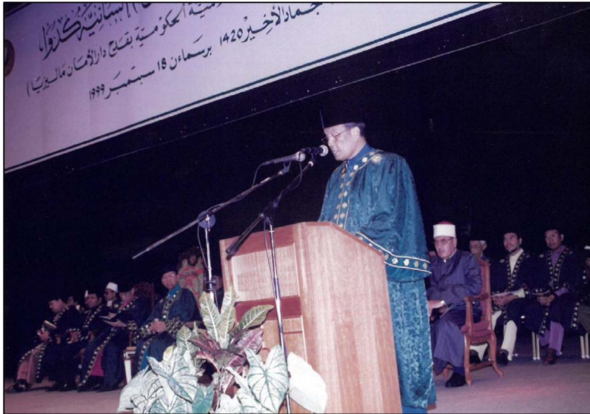
Ucapan aluan daripada Pengarah INSANIAH.