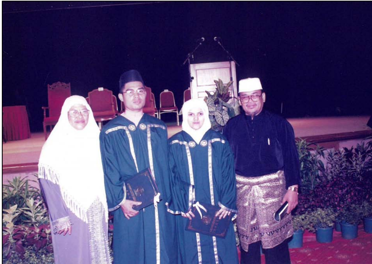
Bergambar bersama keluarga.