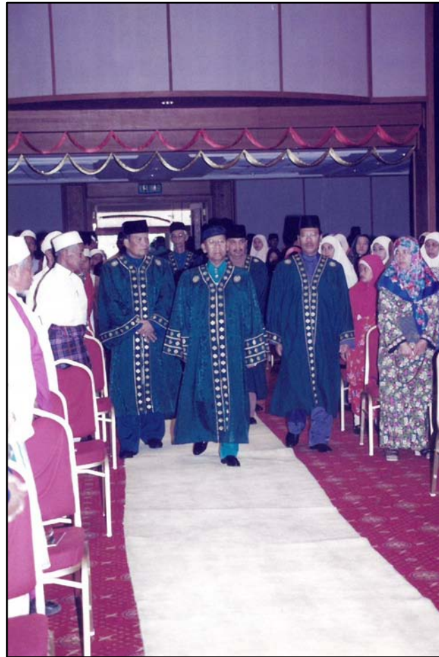
Perarakan Diraja tiba di dalam dewan.