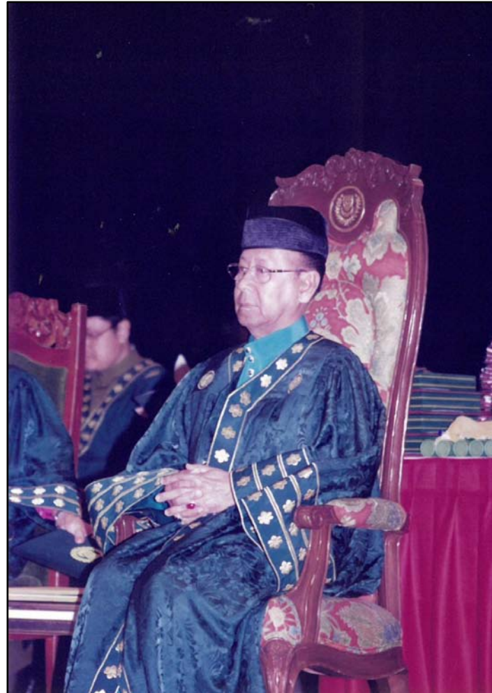
KDYMM Tuanku Sultan ketika istiadat berlangsung.