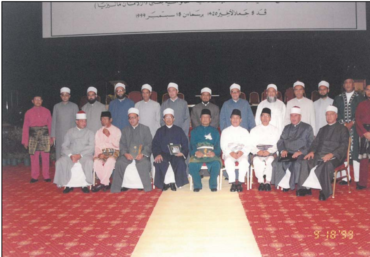
KDYMM Tuanku Sultan Abdul Halim Mu'adzam Shah Ibni Almarhum Sultan Badlishah bertitah menyempurnakan Majlis Haflluttakharruj Ke-2 pada 18 September 1999 di Dewan Seri Negeri, Wisma Darul Aman.