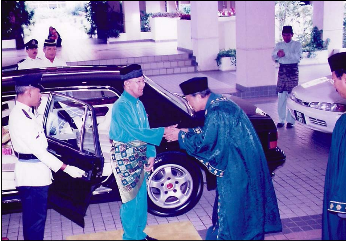
Keberangkatan tiba KDYMM Tuanku Sultan Abdul Halim Mu'adzam Shah Ibni Almarhum Sultan Badlishah disambut oleh Pengarah INSANIAH.