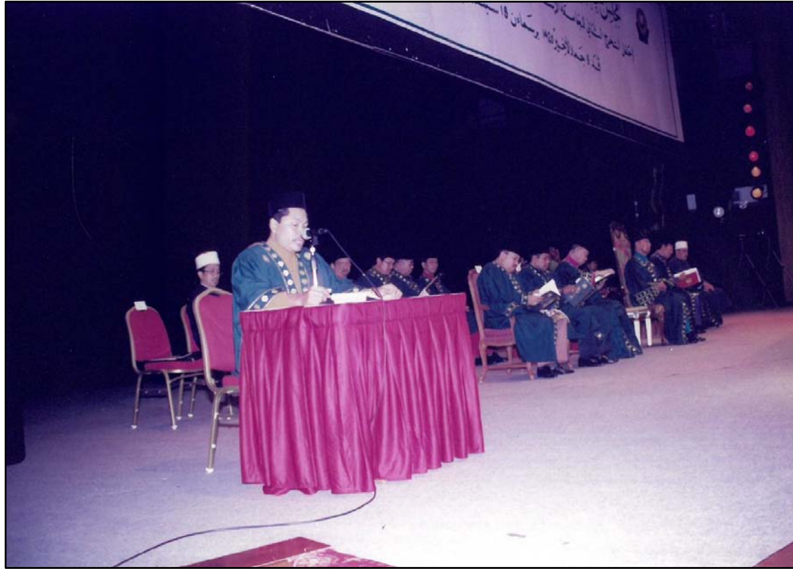
Qari memperdengarkan bacaan ayat suci Al-Quran.