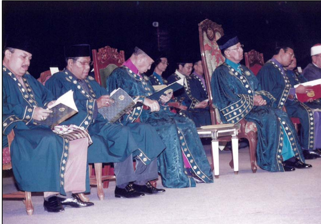
KDYMM Tuanku Sultan , DYTM Raja Muda Kedah bersama Ahli Majlis INSANIAH mendengar bacaan ayat suci AlQuran oleh Qari jemputan.