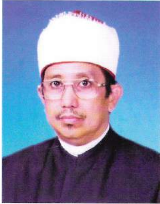
فروفيسور دوكتور سيد محمد عقيل بن علي المهدي (تيمبالن فغارہ أكاديميك)